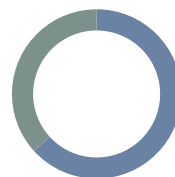
Distribución por plazos

■ 2,09% Liquidez y Repos ■ 97,91% RF Cuasi Soberana