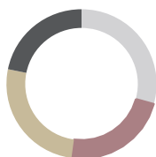
Distribución por Ratings

■ 0,00% B ■ 0,00% Ba ■ 29,30% Baa ■ 22,84% A ■ 26,03% Aa ■ 21,83% Aaa