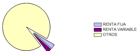
Distribución por tipo de activo